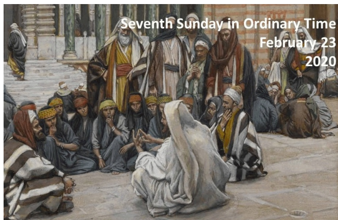
Séptimo Domingo del Tiempo Ordinario